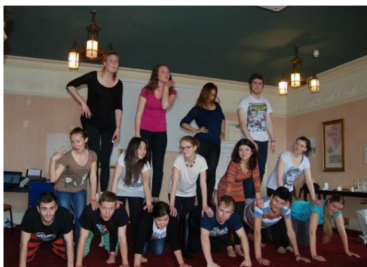
Get Active – Velká Británie