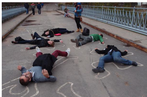
Art as an international language – Bulharsko