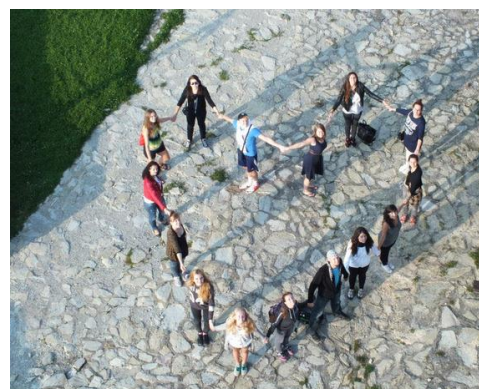
Breaking the communication barriers - Chorvatsko