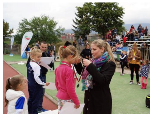
European Volunteers in Sport