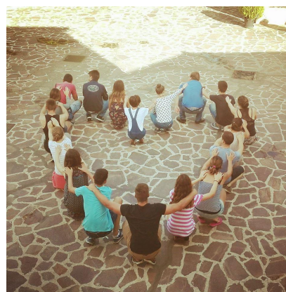
War & P.E.A.C.H.