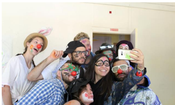
Let's Play for Social Inclusion