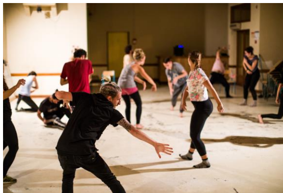
Mind Your Body