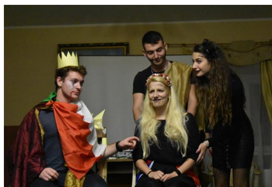
More Mosaic Everywhere for Everyone Always, Activity 2

V tomto období jsme vyslali dalších 6 dobrovolníků na projekty Evropské dobrovolné služby (EVS) / Evropského sboru solidarity (ESC):