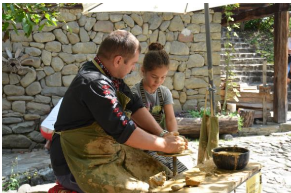
Social Entrepreneurship Training